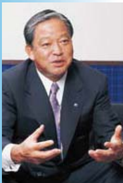
株式会社サニックス 代表取締役社長