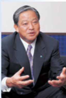
株式会社サニックス 代表取締役社長